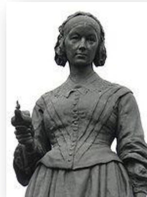
פסלה של נייטיגיל בכיכר ווטרלו בוסטמינסטר, לונדון

כיום מקובל לראות בה את אחד מעשרת הסטטיסטיקאים הבולטים שתרמו תרומה משמעותית בכל הזמנים.