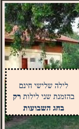
לילה שלישי חינם בהזמנת שני לילות רק בחג השבועות